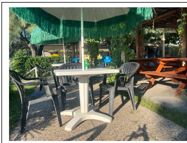
Tavoli esterni bar ristorante